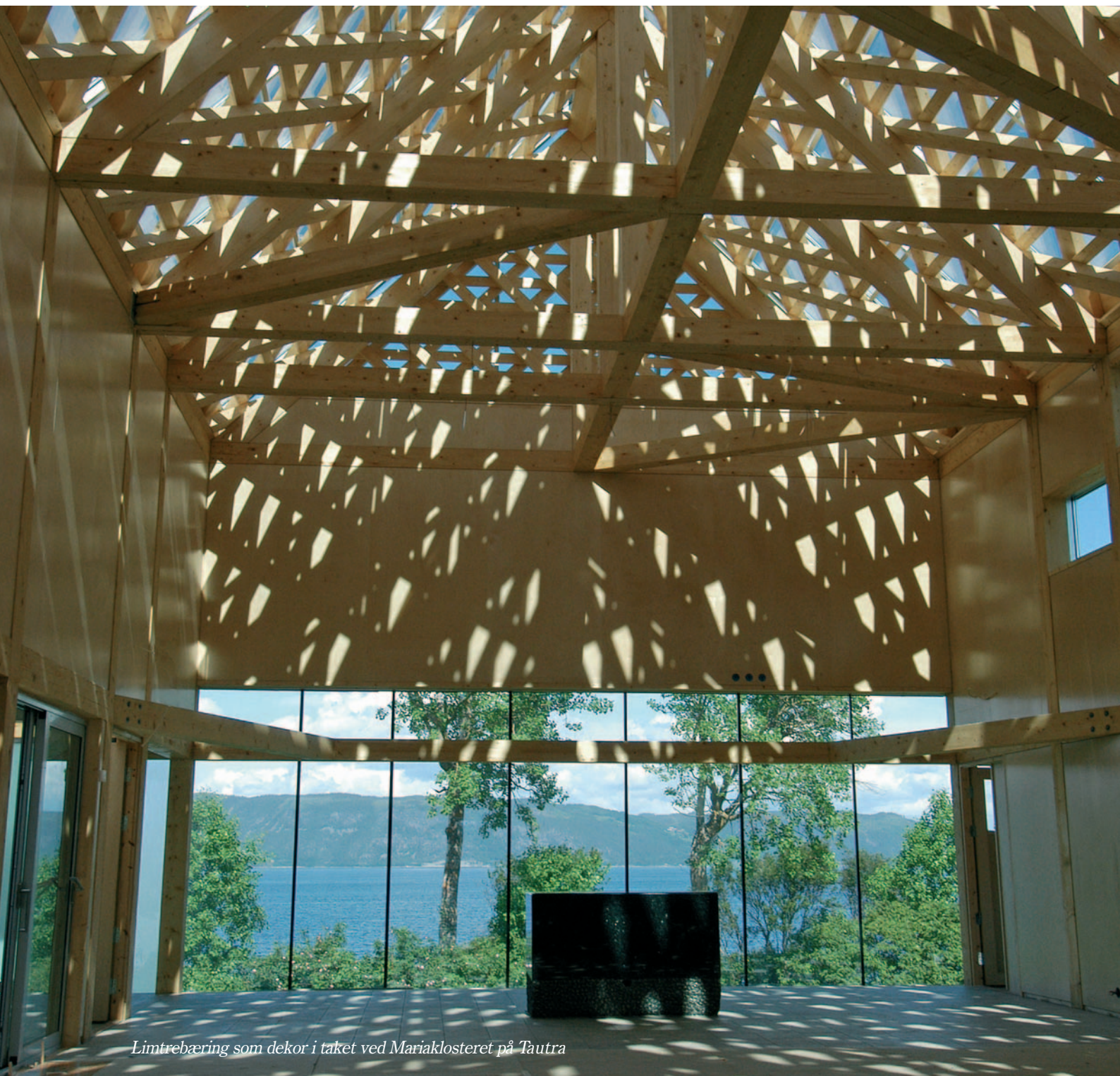
Limtrebæring som dekor i taket ved Mariaklosteret på Tautra